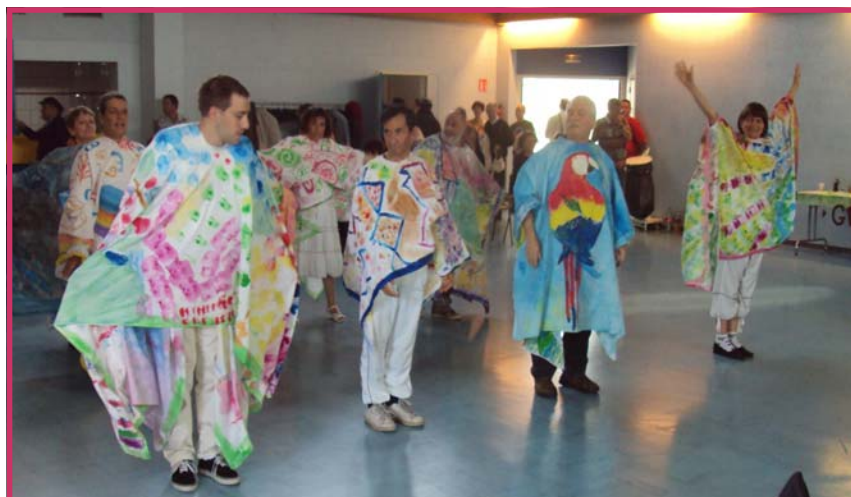
L'atelier danse des Invités à la rencontre interGEM de Franche-Comté.

GEM "La Fontaine" - 10 rue de la Cassotte 25000 Besançon Tel : 03.81.88.90.30 - Mail : gem.lafontaine@laposte.net Le GEM est ouvert tous les jours de 9h à 12h et de 14h à 18h